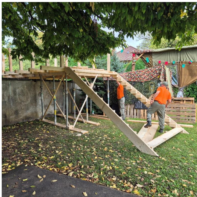
Einsatz zu Gunsten der Gemeinschaft: Erstellen von Hilfskonstruktionen