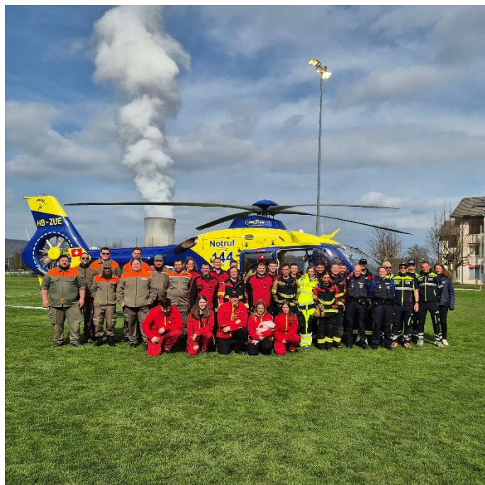
Öffentlichkeitsarbeit: Schule Leibstadt