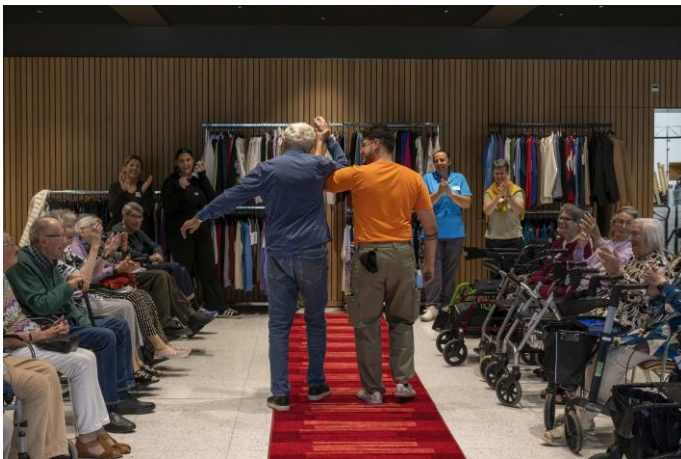
WK-Betreuung; Modeshow im Altersheim